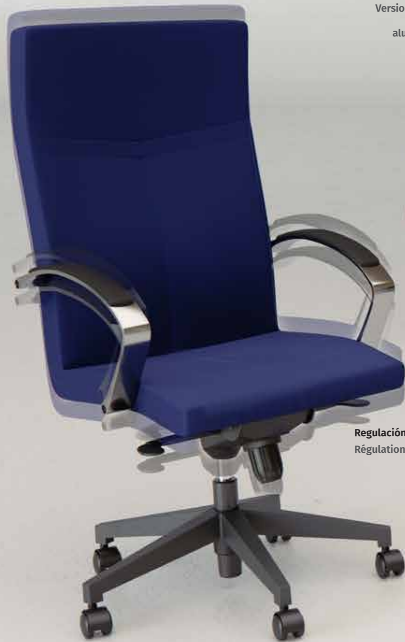
Regulación en altura. Régulation hauteur.