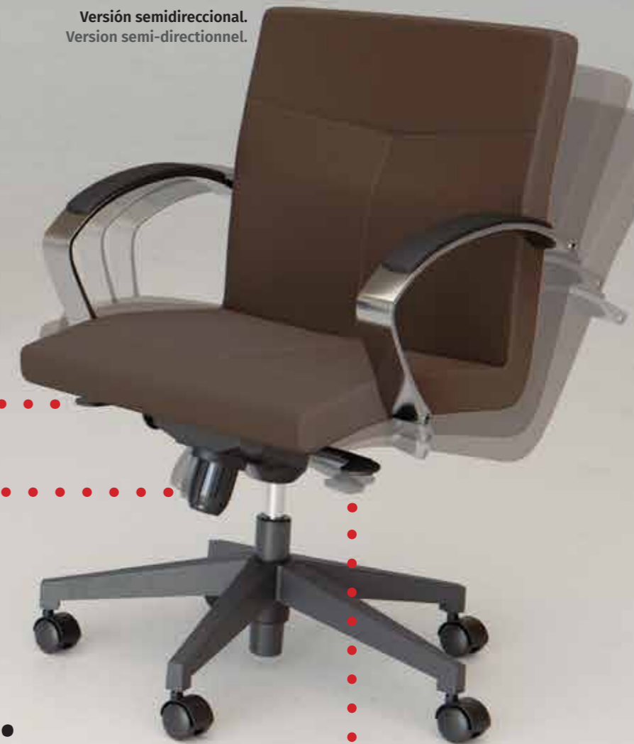
Versión semidireccional. Version semi-directionnel.