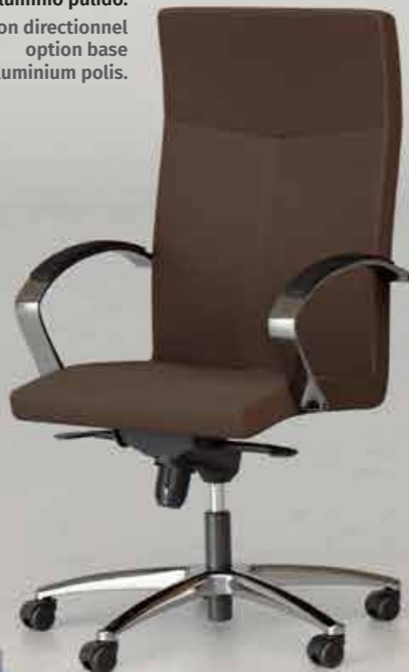
Versión direccional, opción base de aluminio pulido. Version directionnel option base aluminium polis.