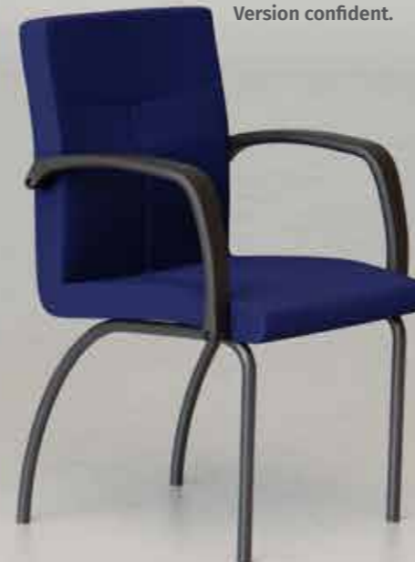
Versión confidente. Version confident.